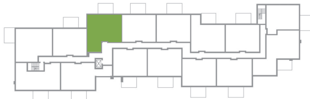
ÉTAGES 2, 3, 4